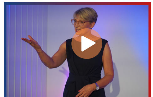
Testimonials Masterclass Moderation